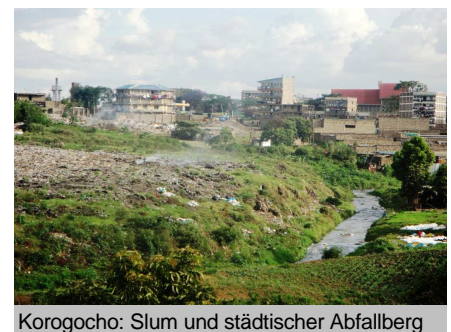
Korogochi: Slum und städtischer Abfallberg